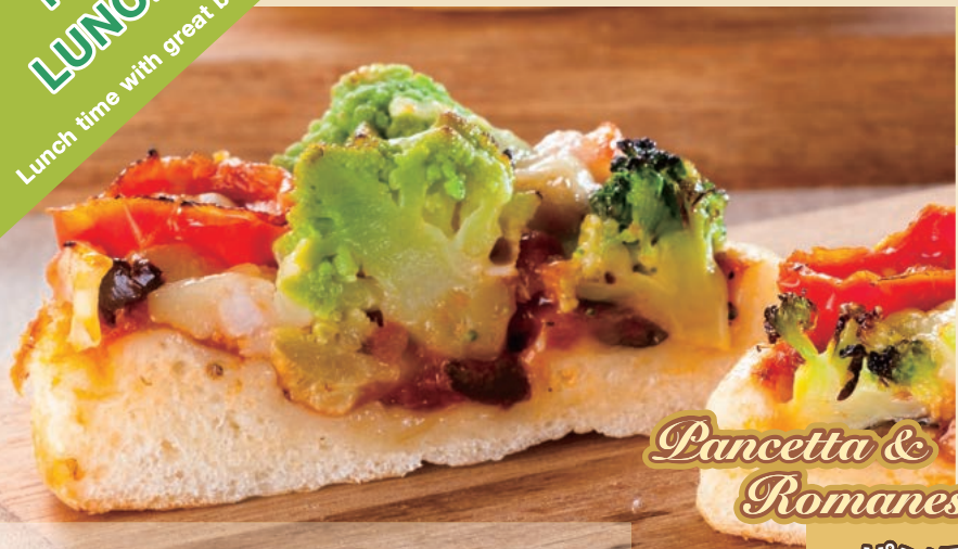
Pancetta & Romanesco

具たくさんのトマトソースの上に色とりどりのたっぷり野菜と旨みの凝縮されたパンチェッタをのせました。彩りも味も華やかなピゼッタです。